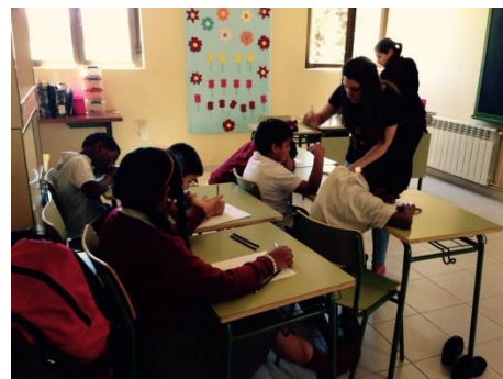
Algunos de los trabajos realizados